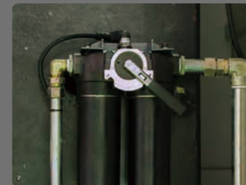
自動偵測雙回路過濾系統