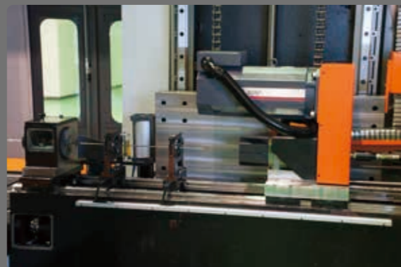
支撐架自動歸位系統