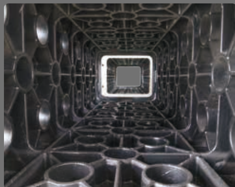
立柱及工作台-三角肋搭配圓肋結構設計