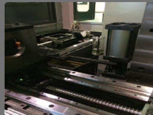
Z軸前極限特殊浮動式設計